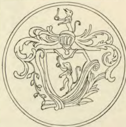
(Поле золотое, левъ и ключъ желтые).