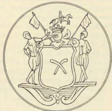
(Поле серебряное, фигуры сѣрыя, всадникъ въ синемъ).