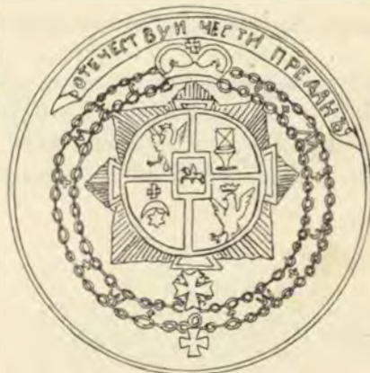
(1) поле серебряное, орелъ бѣлый, корона желтая; 2) поле черное, стулъ желтый, съ малин. подушкой; 3) поле синее, мѣсяцъ и звѣзда бѣлые, крестъ желтый; 4) поле красное, орелъ бѣлый, корона желтая; 5) поле красное, орелъ бѣлый. Девизъ: ОТЕЧЕСТВУ И ЧЕСТИ ПРЕДАНЪ).