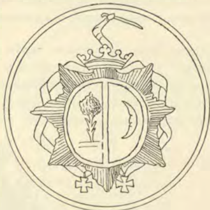
(1) поле серебряное, дерево зеленое; 2) поле золотое, мѣсяцъ бѣлый).