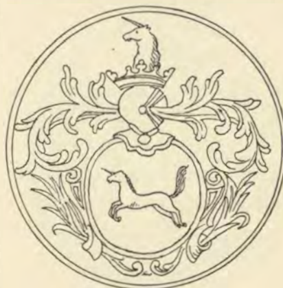
(Поле синее, единорогъ бѣлый).