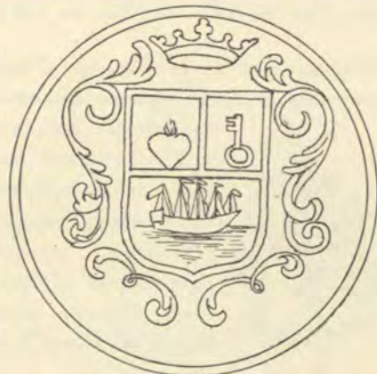
(Поле серебряное, сердце красное, ключъ золотой, корабль коричневый, вода синяя).