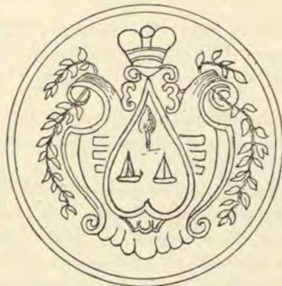
(Поле серебряное, дерево зеленое, фигуры сѣрыя).