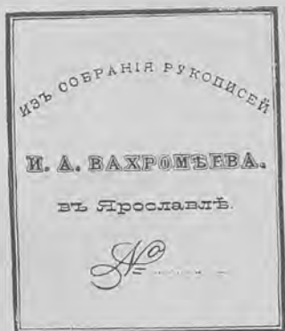
Рис. 71.—Книжный знакъ И. А. Вахрамѣва.

а. Кн. ярл. 4-гр. 74×74. п. тип. однцв., съ надписью: „Изъ собранія ру-