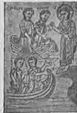
ИЗЪ СОБРАНІЯ КНИГЪ Ѳ. Т. Васильева. № шкафъ полка