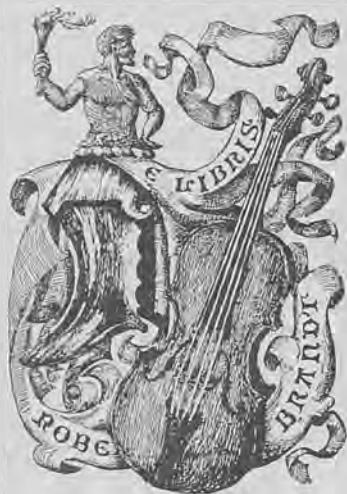
Рис. 60.—Книжный знакъ Р. Брандта.

Кн. ярл. 4-гр. 85×66. (размѣръ доски) г. д. грав. однв., съ изображеніемъ скрипки и части герба, и съ надписью: „E Libris Robe. Brandt“ (2-ой половины XIX ст.) (см. В. А. Верещагинъ, „Русскій книжный знакъ“, Спб. 1901 г. стр. 52, рис. № 66). Рис. 60.