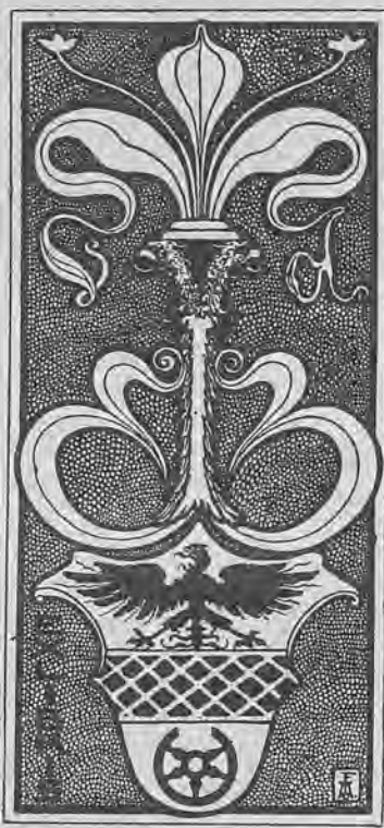
Рис. 61.—Книжный знакъ баронессы И. Е. фонъ-дерь-Бриггенъ.

Кн. ярл. 4-гр. 121×63 г. д. лит. однв. (коричневый рисунокъ на бѣлой бумагѣ) съ изображеніемъ флорентійской лилии, соединеннаго герба Фель-