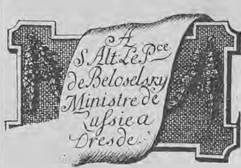
Рис. 65.—Нижний знакъ кн. А. М. Бѣлосельскаго-Бѣлозерскаго

посланникъ въ Дрезденъ и Туринъ, писатель. Род. въ 1752 г. † 26-го декабря 1806 г. въ Сиб. (см. Д. А. Ровинскій, „Подробный словарь русскихъ гравированныхъ портретовъ“, Спб. 1889 г. т. I. стр. 400—401; С. А. Венгеровъ, „Источники словаря русскихъ писателей“, Спб. 1900 г. т. I. стр. 451; „Подробный иллюстрированный каталогъ выставки русской портретной живописи“, изданіе Общества Сняго Креста, Спб. 1902 г. стр. 44, 52).