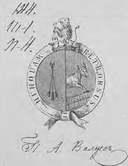
Рис. 68.—Книжный знакъ графа П. А. Валуева.

Государственныхъ Имуществъ; въ 1880 г. возведенъ въ графское Россійской Имперіи достоинство и назначенъ председателемъ Комитета Министровъ; членъ Государственнаго Совѣта.