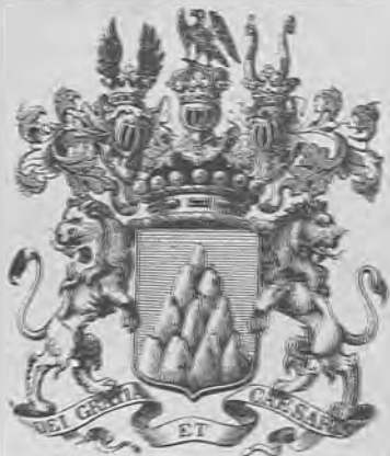
Рис. 66. —Нижний знакъ барона Ѳ. А. Бюлера.

Баронъ Ѳ. А. Бюлеръ, д. т. с., гофмейстеръ Двора Его Императорскаго Величества, почетный опекунъ, директоръ Главнаго Архива Министерства Иностранныхъ Дѣлъ въ Москвѣ, почетный членъ Императорской Академіи Наукъ и многихъ русскихъ и иностранныхъ обществъ. Род. 8-го апрѣля 1821 г. въ с. Мануиловъ, Ямбургскаго уѣзда † 10-го мая 1896 г. Воспитанъ въ Императорскомъ Училищѣ Правовѣднѣи, въ которомъ окончилъ курсъ въ 1841 г. Въ 1855 г. былъ управляющимъ газетною экспедиціею Министерства Иностранныхъ Дѣлъ, затѣмъ, членомъ Главнаго Управленія Цензуры и цензоромъ политическаго отдѣла журналовъ; въ 1873 г. назначенъ директоромъ архива. (см. „Московскій Главный Архивъ Министерства