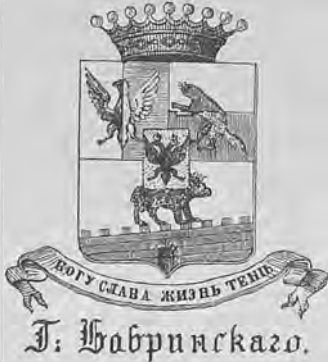
Рис. 56.—Книжный знакъ графа А. А. Бобринскаго.

должность старшего секретаря. Въ 1850 г. назначенъ чиновникомъ особыхъ порученій Министерства Внутреннихъ Дѣлъ, а въ 1853 г. — вице-директоромъ хозяйственнаго Департамента. Въ 1855 г. вступилъ въ ополченіе и командовалъ, въ чинѣ штабсъ-капитана, 4-ой ротой дружины № 2 ополченія. Въ 1861 г. назначенъ Спб. губернаторомъ, а съ 1869—1872 г. былъ Спб. губернскимъ предводителемъ дворянства. Въ 1890 г. пожалованъ въ оберъ-гоф-