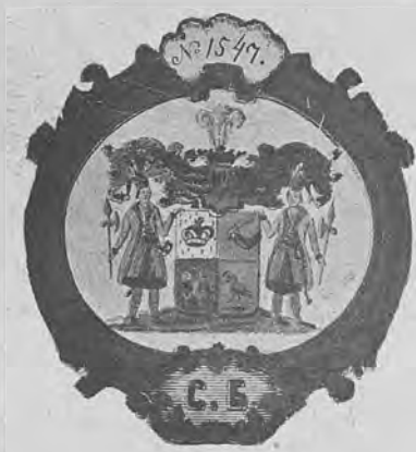
Рис. 64.—Нижний знакъ С. С. Бутурлина.

Библиотека генерала С. С. Бутурлина содержитъ въ себѣ около 1000 томовъ и состоитъ изъ слѣдующихъ главныхъ отдѣловъ: 1) генеалогія, 2) русская исторія и 3) юридическія науки.