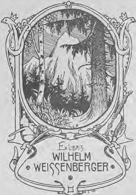
Рис. 73.—Видный знанъ В. Вейсенбергера.