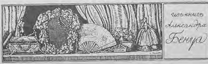
Рис. 50.—Книжный знакъ А. Н. Бенуа.

БЕЗПЛАТНАЯ НАРОДНАЯ БИБЛИОТЕКА-ЧИТАЛЬНЯ ВЪ Г. ИР- КУТСКЪ.