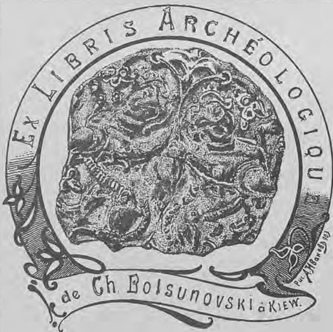
Рис. 58.—Нижний знак Н. В. Болсуновскаго.

в. Кн. ярл. 4-гр. 86×63 г. д. фотогр., съ изображеніемъ монаха, поляка-солдата, двухъ рыбъ и герба