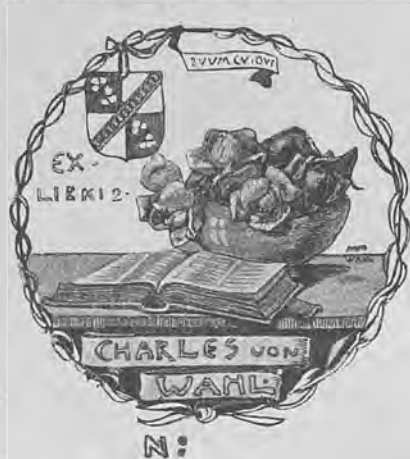
Рис. 69.—Книжный знакъ К. Э. фонъ-Валъ.

а. Кн. ярл. 4-гр. 70×68. г. д. лит. однцв. (на коричневой бумагѣ) съ изображеніемъ вазы съ розами, книги и