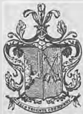
Рис. 297.—Нижний знакъ Д. П. Северина.

б) Кн. ярл. 4-гр. 55×44 г. грав. однц., съ гербомъ Севериныхъ и девизомъ: „Illo tegente conaerent.“ Рис. 297.