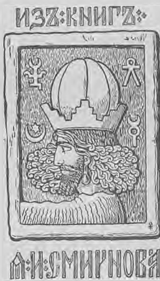
Рис. 305.—Книжный знакъ Я. И. Смирнова.

Я. И. Смирновъ, археологъ, хранитель Императорскаго Эрмитажа, членъ-корреспондентъ Императорскаго Московскаго Археологическаго Общества (съ 1894 г.).