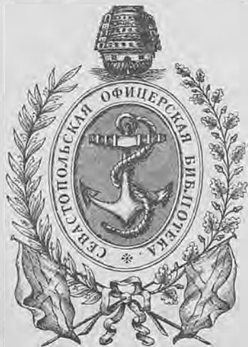
Рис. 295.—Книжный знакъ Севастопольской Офицерской Библиотеки.

Кн. ярл. 4-гр. 78×61 д. грав. одноцв., съ изображеніемъ стариннаго корабля,