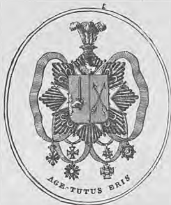
Рис. 296.—Нижний знакъ Д. П. Северина.

а) Кн. ярл. овал. 61×52 г. грав. однц., съ гербомъ Севериныхъ и девизомъ: „Age tutus eris“ (1-ой половины XIX ст.). Рис. 296.