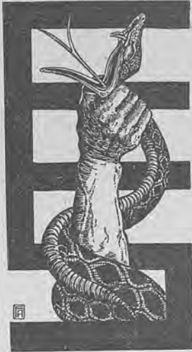
Рис. 308.—Нижний знакъ д-ра Э. Соколовскаго.