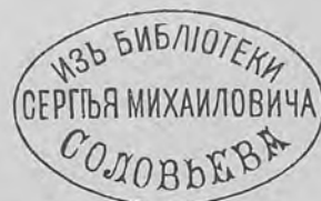
Рис. 310.—Книжный знакъ С. М. Соловьева.

Кн. шт. овал. 28×45, съ надписью: „Изъ Библиотеки Сергѣя Михайловича Соловьева“ (середины XIX ст.) Рис. 310.