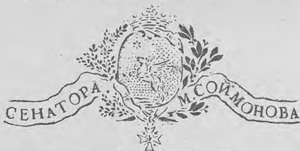
Рис. 307.—Нижний знакъ М. О. Соймонова.

Кн. ярл. 4-гр. 96×60 д. пгр. одниц., съ изображеніемъ руки съ змѣей и съ вензелемъ „E.S.“. Рис. баронъ Арминій Евгеніевичъ фонъ-Фелькерзамъ, Спб., 1899 г.