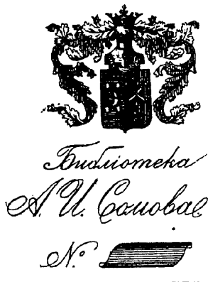
Рис. 312.—Нижний знакъ А. И. Сомова.

А. И. Сомовъ, старшій хранитель Императорскаго Эрмитажа по отдѣленію картинъ, гравюръ и эстамповъ. Род. 11-го мая 1830 г. Воспитывался въ Императорскомъ Спб. Университетѣ; учился рисованію въ Рисовальной Школѣ Министерства Финансовъ (впоследствии