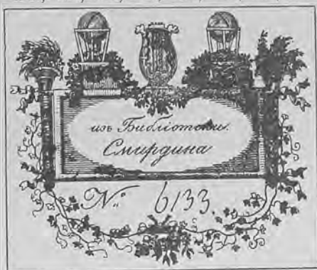
Рис. 304.—Книжный знакъ А. Ф. Смирдина.

б) Кн. ярл. 4-гр. 70×111 п. тип. одниц., съ надписью: „Изъ Библиотекы для чтенія А. Смирдина №...“