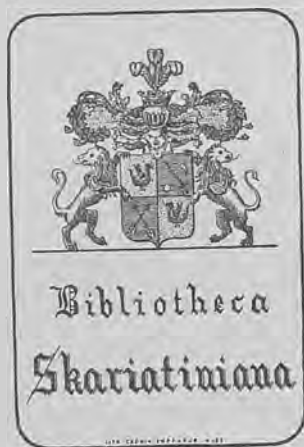
Рис. 303.—Книжный знакъ Скарятина.

Кн. ярл. 4-гр. 79×52 г. лит. однцв. (на бумагѣ песочнаго цвѣта), съ гербомъ Скарятинныхъ и надписью: „Bibliotheca Skariatina“. Исполненъ въ литографіи Cauvin въ Ниццѣ (середины XIX ст.). Рис. 303.