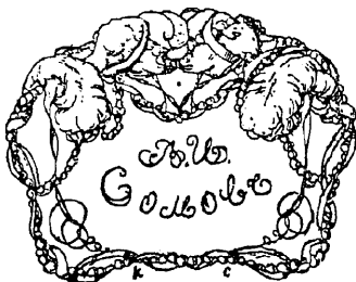
Рис. 313.—Нижний знакъ А. И. Сомова.

А. И. Сомовъ, старшій хранитель Императорскаго Эрмитажа по отдѣленію картинъ, гравюръ и эстамповъ. Род. 11-го мая 1830 г. Воспитывался въ Императорскомъ Спб. Университетѣ; учился рисованію въ Рисовальной Школѣ Министерства Финансовъ (впоследствии