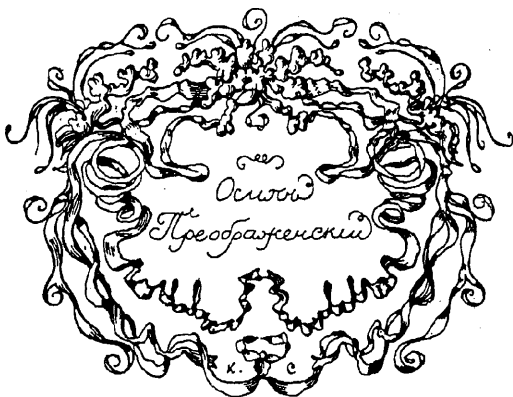
Рис. 276. Книжный знакъ О. О. Преображенскаго.