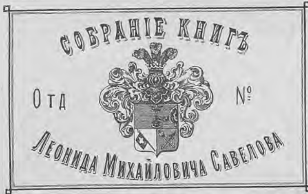
Рис. 288.— Книжный знакъ Л. М. Савелова.