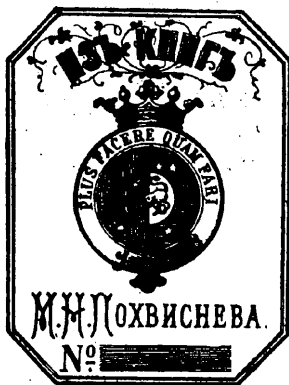
Рис. 275. Книжный знакъ М. Н. Похвиснева.

М. Н. Похвисневъ, тайный совѣтникъ, сенаторъ, начальникъ главнаго управленія по дѣламъ печати, собиратель русскихъ портретовъ и библиоманъ. Род. въ 1811 г. † 4-го ноября 1879 г. за границей. (см. Д. А. Ровинскій, Подробный словарь русскихъ гравированныхъ портретовъ, Спб. 1889 г., т. II, стр. 1564—1565).