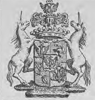
Рис. 290.—Нижний знакъ графа Салтыкова.