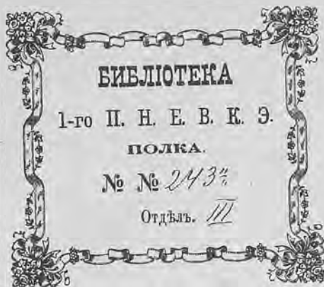
Рис. 279 Книжный знакъ 1-го Пѣхотнаго Невскаго Полка.