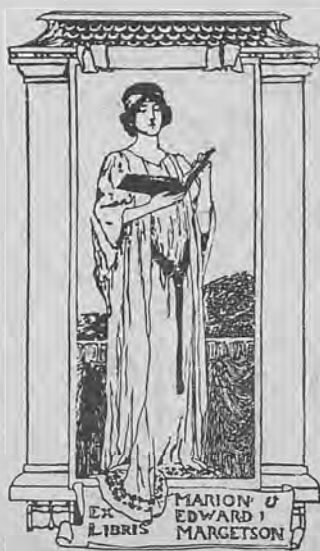
Рис. 282. Книжный знакъ М. and E. Margetson