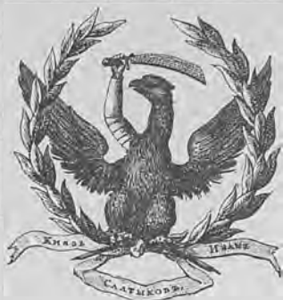
Рис. 292.—Книжный знакъ князя И. Салтыкова.