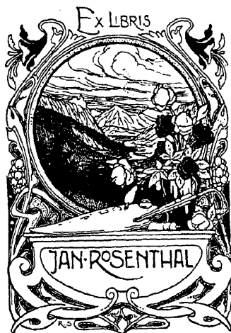
Рис. 284.—Нижний знакъ И. Розенталя.

И. Розенталь, художникъ-живописецъ въ Ригѣ.