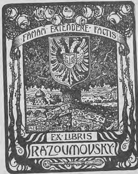
Рис. 283.—Нижний знакъ графа К. Л. Разумовскаго.