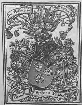
Рис. 280. Книжный знакъ барона А. фонь-Радена.

Кн. ярл. 4-гр. 71×56. д. г. цгр. однц., съ гербомъ бароновъ фонь-Ра-