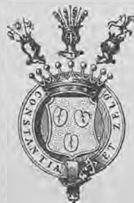
Грѣбъ Л. в. д. Паленъ.

Рис. 261. Нижний знакъ графа Л. Ѳ. фонъ-дерь-Палена.