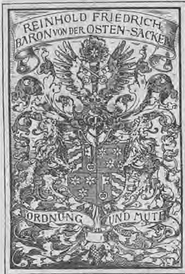
Рис. 258. Нижини знакъ барона Ф. Р. Остенъ-Сакена.

отдѣленія; въ 1865 г. — чиновникъ особыхъ порученій VI класса; въ 1868 г. — дѣлопроизводитель V класса, въ 1871 г. — вице-директоръ того же департамента, а съ 1875 г. состоитъ директоромъ департамента внутреннихъ сношеній. (см. „Альманахъ современныхъ русскихъ государственныхъ дѣятелей,“ изданіе Г. А. Гольдберга, Спб. 1897 г. стр. 1180).