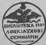
Рис. 272. Нижний знакъ Полоцкой Духовной Семинаріи.