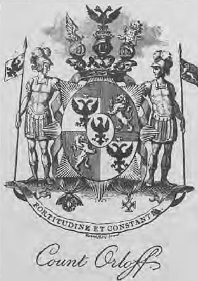
Рис. 255. Книжный знакъ графа Орлова.