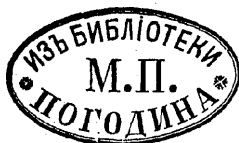
Рис. 269. Книжный знакъ М. П. Погодина.

М. П. Погодинъ, д. с. с., ординарный профессоръ Императорскаго Московскаго Университета, ординарный академикъ Императорской Академіи Наукъ, извѣстный историкъ-археологъ и журналистъ; почетный членъ Императорскаго Московскаго Университета, Императорской Публичной Библиотеки и многихъ ученыхъ обществъ; докторъ философіи Пражскаго университета, издатель журнала: „Москвитянинъ.“ Род. 11-го ноября 1800 г. въ Москвѣ † 8-го декабря 1875 г. Сынъ крѣпостнаго „домоправителя“ графа Салтыкова Петра Моисеевича Погодина. Первоначальное образование получить у типографщика Рѣшетникова вмѣстѣ съ сыномъ послѣдняго. Въ 1814 г. М. П.