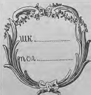
Рис. 271. Нижний знакъ А. А. Половцова

А. А. Половцовъ, д. т. с. членъ Государственнаго Совѣта, статсъ-секретарь, сенаторъ. Род. 31-го мая 1832 г. въ Спб. Окончивъ