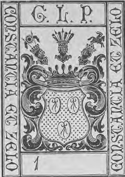
Рис. 262. Книжный знакъ графа Л. Ф. фонъ-деръ-Палена.

Chronica и др. рѣдкія изданія XV, XVI и XVII ст.; в) классики: латинскіе, греческіе, французскіе, нѣмецкіе и пр.; г) коллекція Альдовъ; д) иллюстрированныя изданія и описанія картинныхъ собраній и галлерей, XVII, XVIII и XIX ст.; е) книги по искусствамъ, наукамъ и исторіи литературы, на разныхъ языкахъ. Всего въ бібліотекѣ около 7000 названій и приблизительно 17000 томовъ. Кромѣ книгъ имѣется собраніе гравюръ, литографій и портретовъ, всего около 500 нумеровъ.