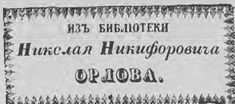
Рис. 256. Нижний знак Н. Н. Орлова.

О. Р. Т. З. см. Общество Распространения Техническихъ Знаній.