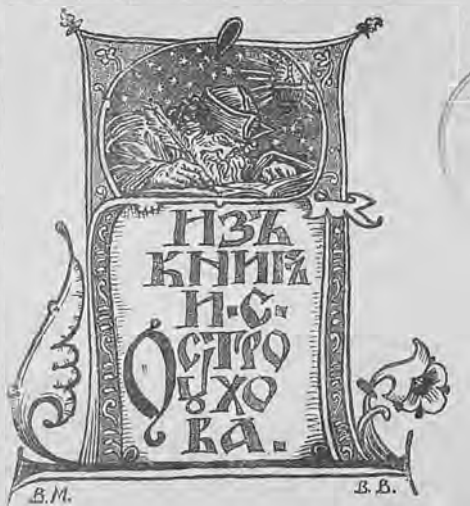
Рис. 260. Книжный знакъ И. С. Остроухова.

б) Кн. яр. 4-гр. 230 × 184 д. однц. (на желтоватой бумагѣ) съ надписью: „Изъ книгъ И. С. Остроухова“. Рисоваль художникъ Викторъ Михайловичъ Васнецовъ, рѣзалъ на деревѣ профессоръ Василій Васильевичъ Матѣ, 1901 г. (см. В. А. Верещагинъ, Русскій книжный знакъ, Спб. 1902 г., стр. 54, рис. № 69; „Печатное Искусство“ 1902 г. июль—