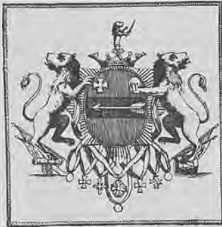
Рис. 267. Книжный знак генерала Писарева.

Тот же ex-libris съ обрѣзанной подписью, употреблявшійся для гравюръ. Рис. 267.