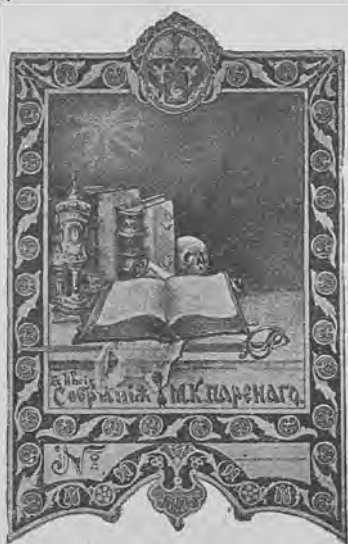
Рис. 264. Книжный знакъ М. К. Паренаго.

М. К. Паренаго, поручикъ, двоюродный братъ послѣдующаго.