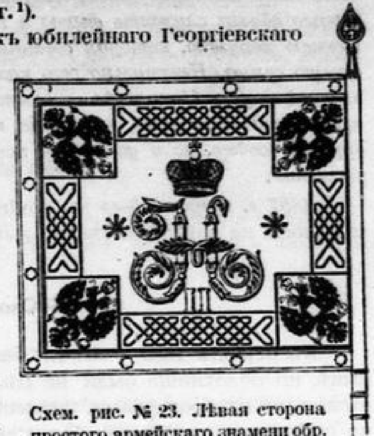
Схем. рис. № 23. Левая сторона простого армейскаго знамени обр. 1896 г. въ 1/2 нат. вел. (по Интенд. изд. перем. обмунд.).

Приказомъ по воен. вѣд. отъ того же числа № 133 объявлено, что законъ о пожалованіи знаменъ при сформированіи лишь полкамъ или баталіонамъ, развертываемымъ въ военное время въ полки, а прочимъ отдельнымъ баталіонамъ только за боевыя отличія или при юбилеяхъ, подлежитъ измѣненію и что, по Высочайшему повелѣнію, впредь знамена «будутъ жаловаться каждой отдельной войсковой части при самомъ ея сформированіи,