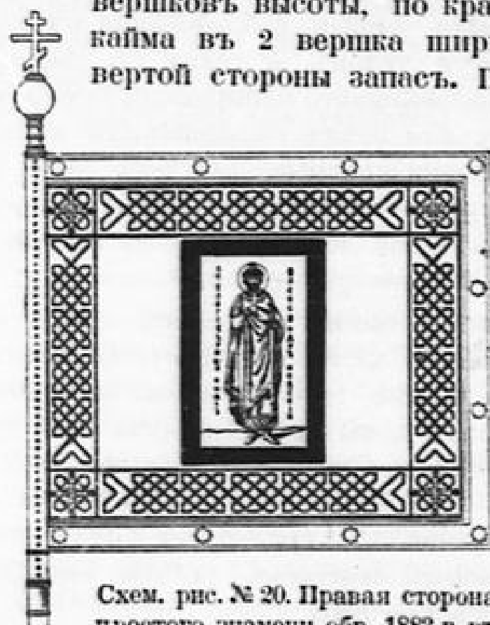
Схем. рис. № 20. Правая сторона простого знамени обр. 1883 г. в \frac{3}{4} нат. вел. (по Инт. изд., схем. табл. и перем. обмунд.).

1883 г. мая 27-го Высочайше утверждены рисунки знаменъ совершенно новаго образца, пожалованныхъ 23-го того же мая, по случаю 200-тъ-лѣтняго юбилея, полкамъ л. гв. Преображенскому и Семеновскому по 1 на полкъ. По рисунку они нѣсколько напоминали старинныя русскіе стяги и были слѣдующаго образца: 1) Шелковое полотнище въ 28 вершковъ длины и 25 вершковъ высоты, по краю съ трехъ наружныхъ сторонъ идетъ кайма въ 2 вершка ширины, также шелковая, образуя съ четвертой стороны запасъ. По внутреннему и наружному краямъ по