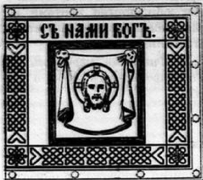
Схем. рис. № 24. Правая сторона полотнища знаменъ обр. 1900 г. въ \frac{1}{2} нат. вел. (по Инт. изд. перем. обмунд.).

1900 г. апрѣля 21-го Высочайше одобрены и введены цѣльнотканная полотнища рисунка 1883 года 1) , причемъ для всѣхъ частей одинаково на лицевой сторонѣ выткано изображеніе образа Спаса Нерукотвореннаго, а надъ нимъ надпись: «Съ нами Богъ». Размѣры, расцѣтка по полкамъ и прочія изображенія оставлены прежнія, но возстановлено изображеніе вензелей, полосъ и звѣздъ на каймѣ золотомъ и серебромъ. Надпись отличія на полотнищѣ не сохранена и осталась лишь на скобахъ.