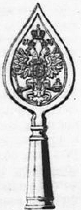
Схем. рис. № 15. Наверхіе простыхъ армейскихъ знаменъ обр. 1857 г. въ \frac{1}{4} нат. вел. (по Инт. изд. перем. обм.).

Знамена такого образца выданы были всѣмъ войсковымъ частямъ, которымъ были пожалованы 30 августа 1856 г. за боевыя отличія въ теченіе Восточной войны 1853—1856 г.г., т. е. баталіонамъ 4-хъ гренадерскихъ и 45-ти пѣхотныхъ полковъ, 3-мъ стрѣлковымъ, 3-мъ сапернымъ и 2-мъ линейнымъ—все Георгіевскія, за исключеніемъ одного знамени 6-го стрѣлковаго батал., получившаго такимъ образомъ первымъ наверхіемъ съ орломъ новаго образца. Новыя наверхія даны были лишь на новыя знамена, на старыхъ же знаменахъ оставлены наверхія прежняго образца (армейскія простыя 1816 г., Георгіевскія 1806 г. и гвардейскія 1830 г.). Знамена вышеописаннаго