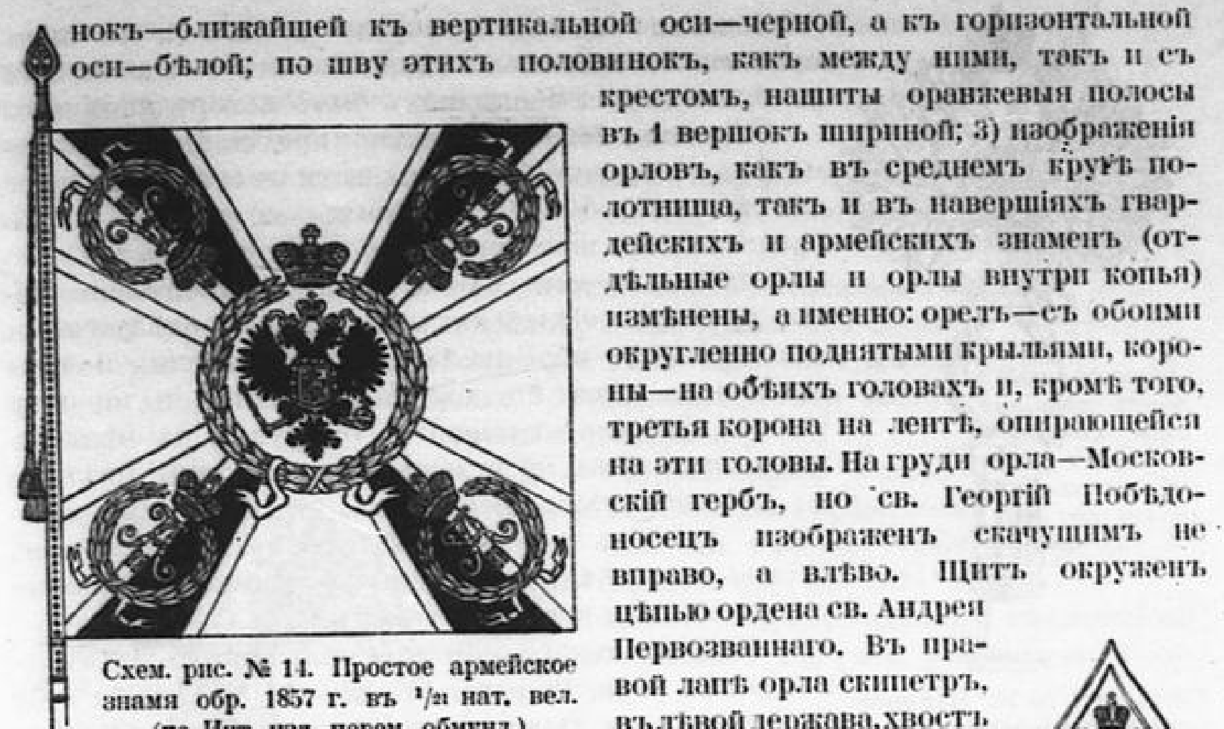
Схем. рис. № 11. Простое армейское знамя обр. 1857 г. въ \frac{1}{2} нат. вел. (по Инт. изд. перем. обмунд.).

1857 г. августа 21-го Высочайше утверждены рисунки знаменъ новаго образца, а именно: 1) крестъ—въ гвардіи у всѣхъ частей желтый (отличія лишь по древкамъ), въ арміи—по полкамъ: красный, свѣтло-синій, бѣлый и зеленый въ пѣхотѣ, малиновый у стрѣлковъ и черный у саперъ; 2) углы—во всѣхъ частяхъ арміи и гвардіи одинаковые, а именно: изъ двухъ полови-