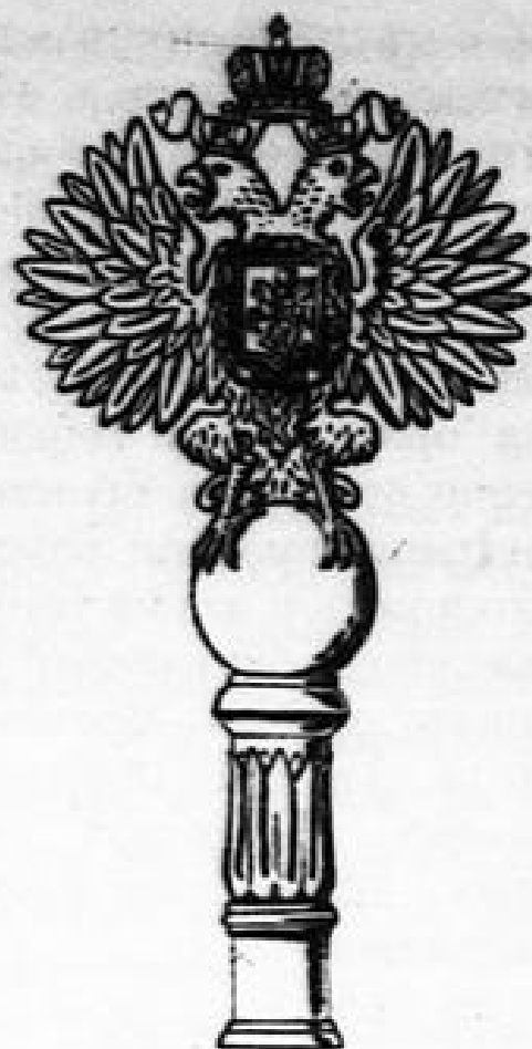
Схем. рис. № 16. Навершие простых гвардейских знамен обр. 1857 г. в \frac{1}{4} нат. вел. (по Инт. изд. перем. обм.).

образца жаловались и впредь до 1876 г., но лишь армейским частям, а гвардейским не жаловались и образец для последних был вскоре изменен.