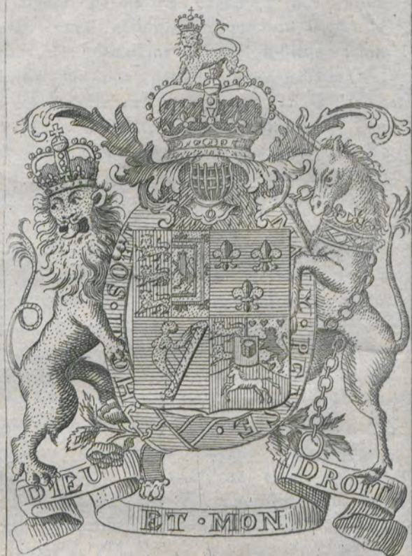
Les armes de la grande Bre: Гербъ Великобританскіе